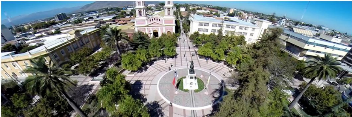
Imagen 2: vista ciudad de Rancagua.

Los Campeonatos Sudamericanos Absoluto y Femenino 2025, tendrán lugar en la ciudad de Rancagua, desde el 03 al 08 de noviembre 2025. La sede del evento será la Universidad de O'Higgins – Biblioteca Central - ubicada en Av. Libertador Gral. Bernardo O'Higgins N° 611, Rancagua.