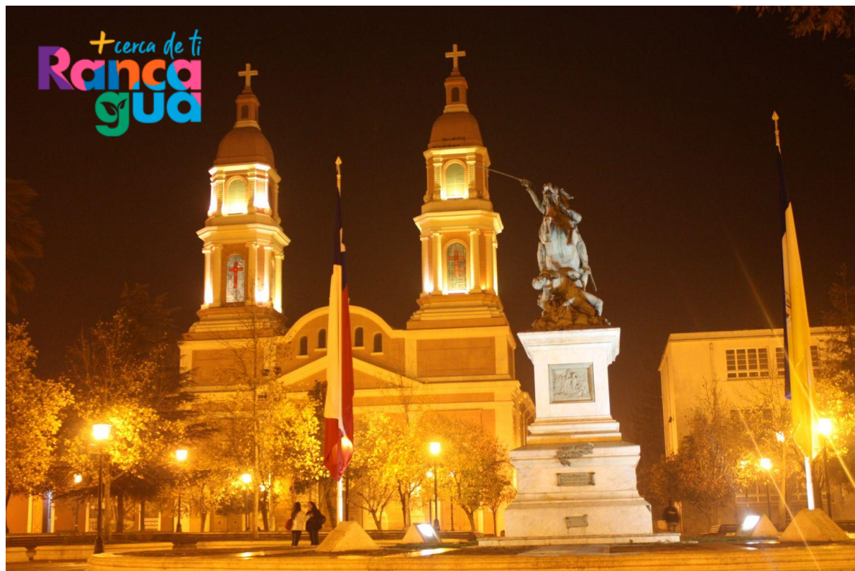
Imagen 1: Plaza de los Héroes.